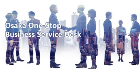
Osaka One-Stop Business Service Desk

(関連記事)「世界とビジネスマッチング」 https://journal.meti.go.jp/p/37385/