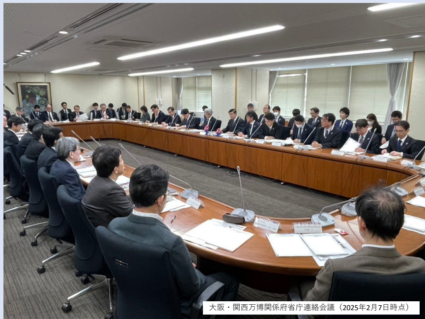
大阪・関西万博関係府省庁連絡会議（2025年2月7日時点）