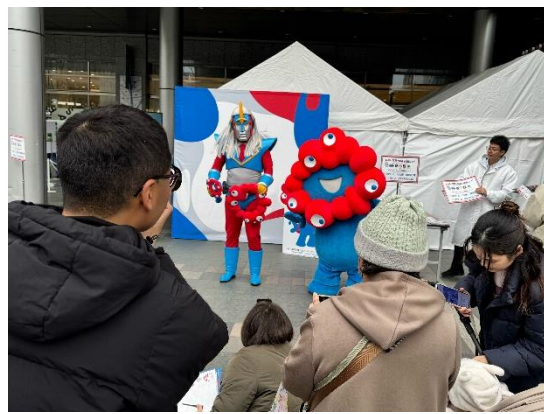
左：万博謎解きゲームの様子 右：万博フォトスポットの様子