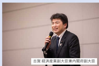
古賀 経済産業副大臣兼内閣府副大臣