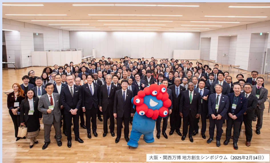
大阪・関西万博 地方創生シンポジウム (2025年2月14日)