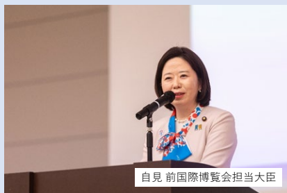
自見 前国際博覧会担当大臣