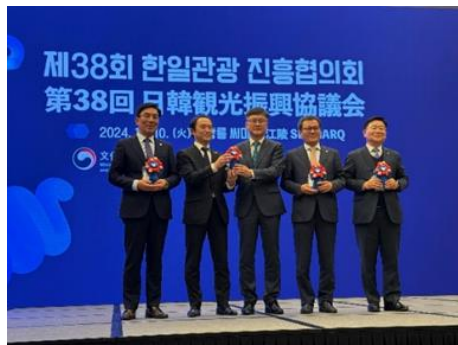
日韓観光振興協議会でのミヤクミヤク贈呈、記念撮影 (左から、チョ・デヨン江陵市議会副議長、中野観光庁国際観光部長、 キム・ジョンフン韓国文化体育観光部観光政策局長、キム・ホンギョ江陵市長、 イ・ハクジュ韓国観光公社国際本部長)