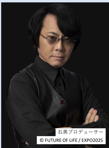
石黒プロデューサー