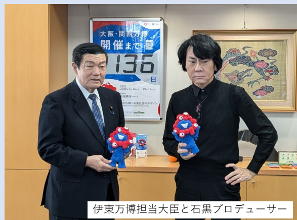
伊東万博担当大臣と石黒プロデューサー