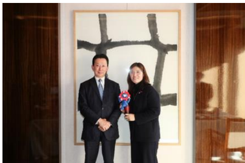
嵯川観光庁長官と 韓国のチャン・ミラン文化体育観光部第二次官