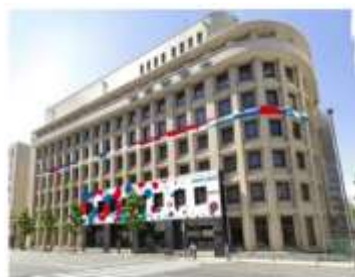
京都支社（イメージ）