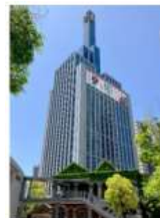
兵庫支社（イメージ）