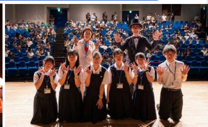
(左) 福岡プロデューサー作「ホタルの光がつなぐもの」の読書会 (右) 自見はなこ国際博覧会担当大臣と福岡プロデューサー、読書会に参加した岩手県立黒沢尻北高等学校の放送部の皆さん