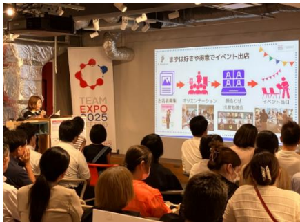
「TEAM EXPO 2025」プログラム参加者の活動紹介