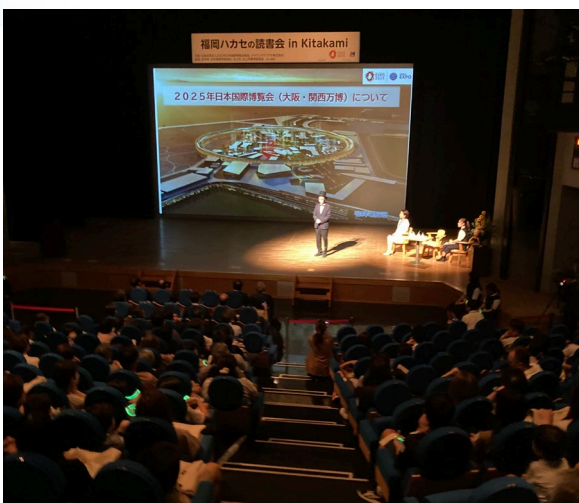
300名以上の親子にご参加いただいた、「福岡ハカセの読書会 in KITAKMI」(於) 岩手県北上市