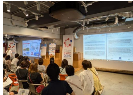
「自動翻訳システム by TOPPAN RemoteVoice」 デモンストレーション