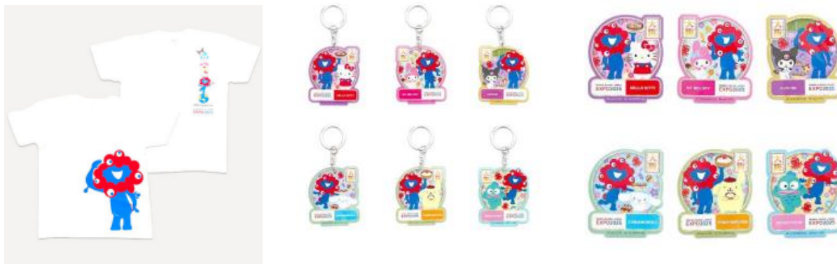
【写真】 コラボ商品のTシャツ、キーホルダー、ステッカー

□ 7/3 (水)、博覧会協会は ハローキティ （万博スペシャルサポーター）など世界で活躍する サンリオのキャラクターたち と ミヤクミヤクのコラボグッズ販売 を発表。12日(金)から全国のオフィシャルストアやオンラインで発売開始を予定。