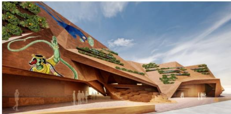
写真：パビリオンイメージ ( https://www.indiatrdefair.com/tenders/offline_tender )