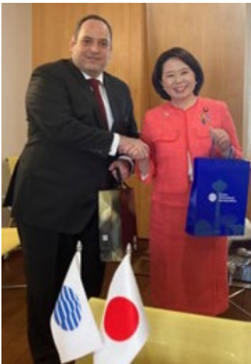
4/29 ケルケンティス BIE 事務局長と 自見大臣 於パリ博覧会国際事務局

2025 大阪・関西万博には、約 160 の国の参加が予定されており、各国大臣・大使や関係者や施工会社の方々などとも力を合わせ、大変な熱意で現在準備を進めてくださっています。